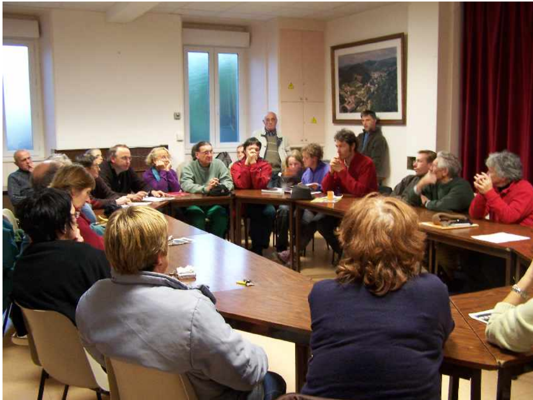
photo du point info 18 h de ce vendredi soir 16 oct 09